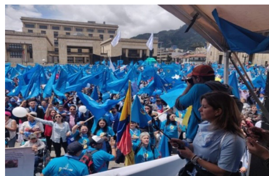
Figura 2. Marcha por la vida