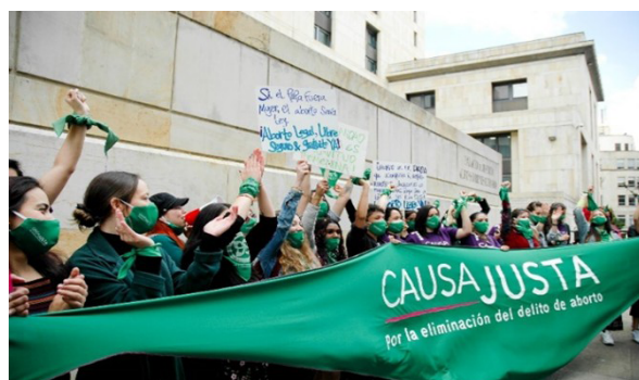
Figura 1. Marcha sentencia C-055.